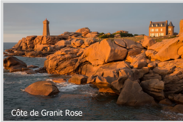
Côte de Granit Rose

Die Bretagne, der Traum eines jeden Fotografen. Und wir haben auch die Zeit und Muse, in diesem einwöchigen Workshop die Fotografie in den Vordergrund zu stellen.