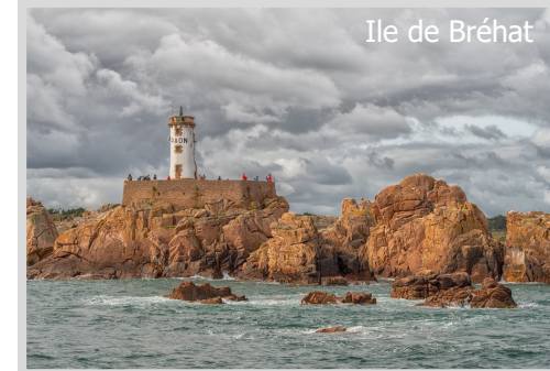
Ile de Bréhat

Die Preise und Leistungen entnehmen bitte dem Anmeldeformular auf unserer Internetseite und beinhaltet 7 Übernachtungen mit Frühstück. Die maximale Teilnehmerzahl beträgt